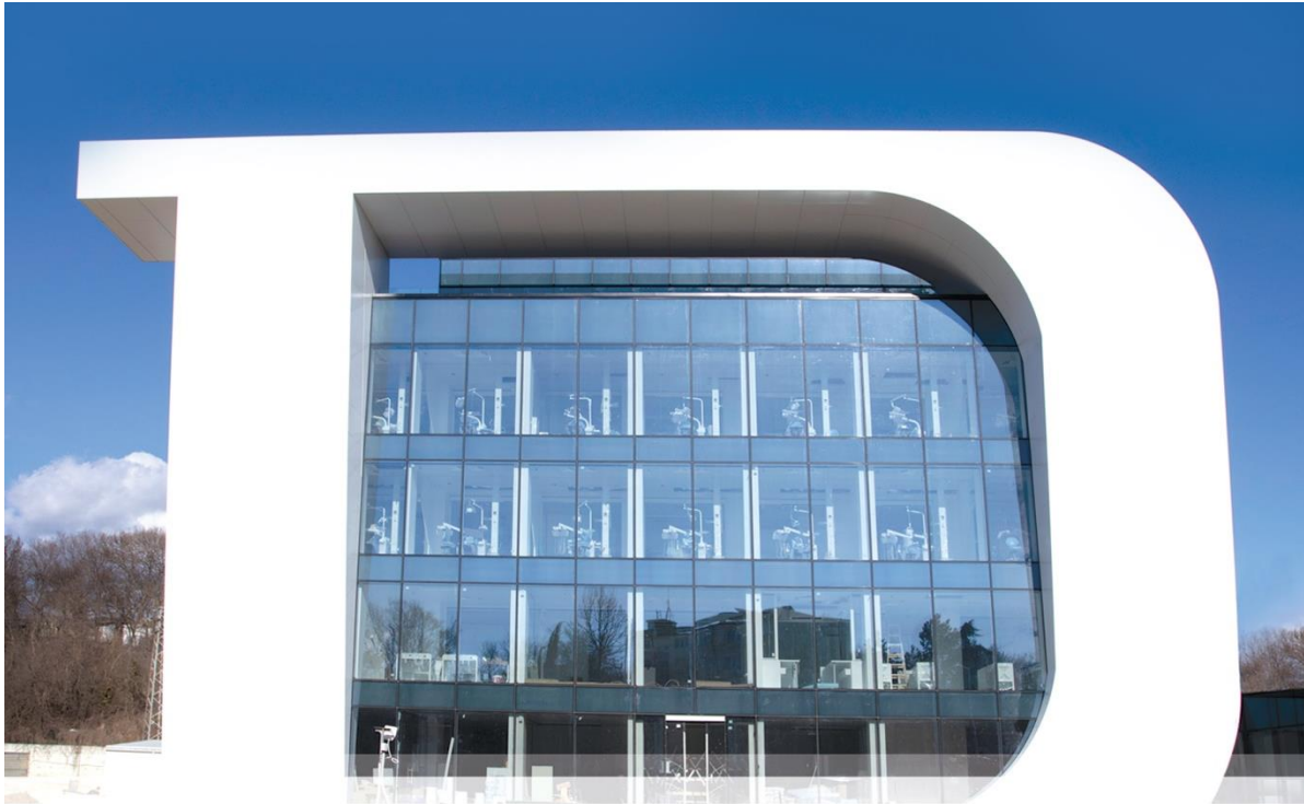
Die Außenfassade des neuen Dentaprime-Behandlungszentrums in Varna